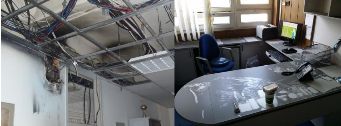
A kigyulladt elosztó környezetének koromszennyeződése

kis részre terjedt ki. A villamos berendezés rendszeres és alapos felülvizsgálatával csökkenthető az ilyen jellegű balesetek bekövetkezésének valószínűsége is.