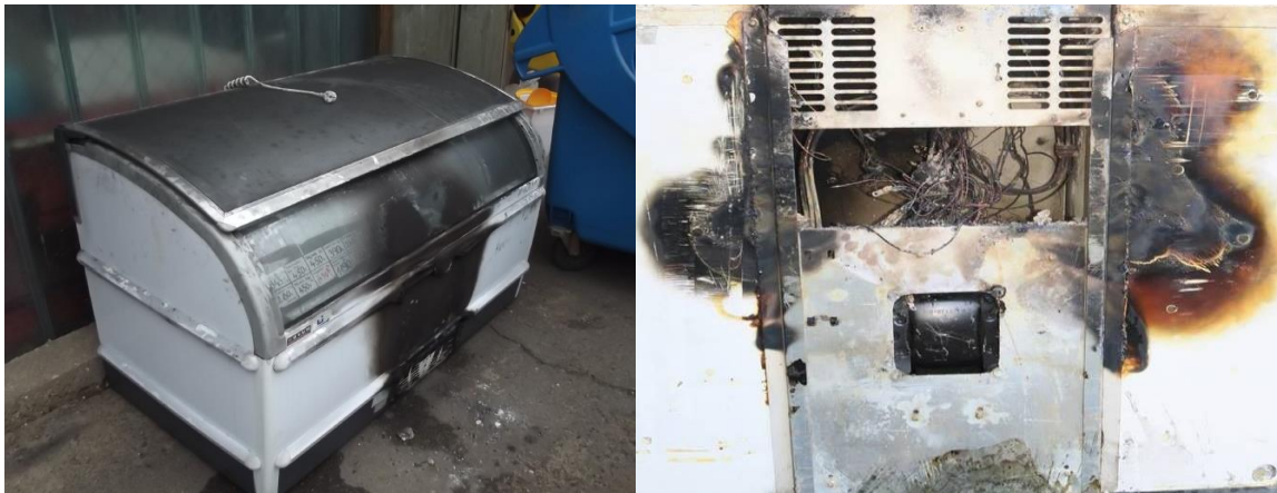
A hűtő és alsó része, ahol a meghibásodás bekövetkezett

Bár a villamos készülékek általánosságban nagyon biztonságosak, elhasználódásuk vagy meghibásodásuk következtében akkor is okozhatnak tüzet, ha egyébként használatuk szabályos módon történik. A bemutatott eset elsősorban arra mutat rá, hogy a vezetékszigetelések és egyéb anyagok égésekor felszabaduló korom olyankor is jelentős kárt okozhat, ha a tűz (az égés) csak kis területre koncentrálódik. Az ilyen jellegű károk bekövetkezését is csökkentheti a készülékek átgondolt elhelyezése, az időszakos felülvizsgálat és a készülékek rendszeres szemrevételezése.