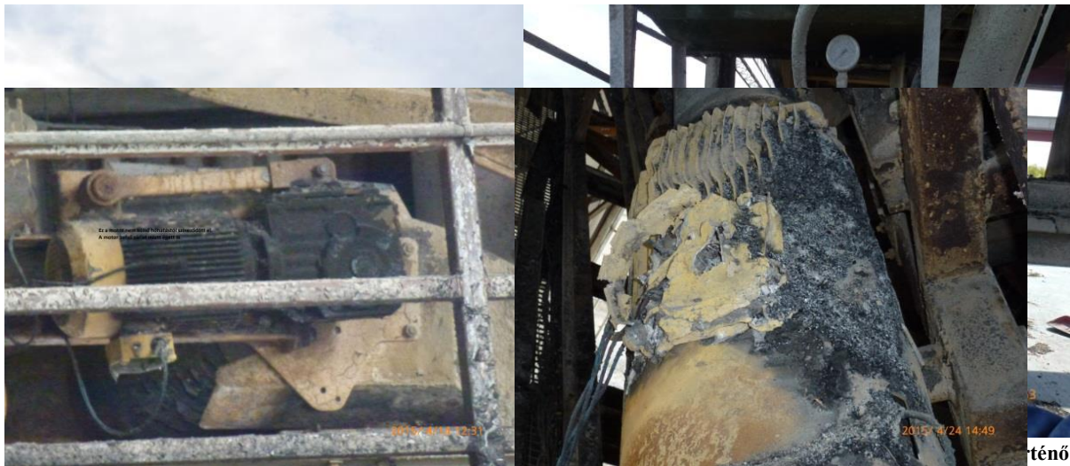
eltávolításáról az üzemeltetőnek kellett volna gondoskodnia A zárlatos motor, a tűz feltételezett forrása

A tűz által nem érintett részeken jól látható a lerakódott por, amely nemcsak a szerkezetek hőleadását gátolja, de – jelen esetben – anyagánál fogva könnyen meggyullad és elősegíti a lángterjedést. A karbantartás részeként a szennyeződést rendszeres időközönként el kellett volna távolítani.